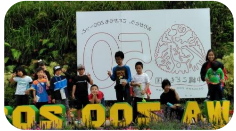
・3グループに分かれて「動物園」内を散策。友だちに声を掛けながら、「あっち行く?こっち行く?」と行きたい場所を話し合いながら、回ることが出来ました。