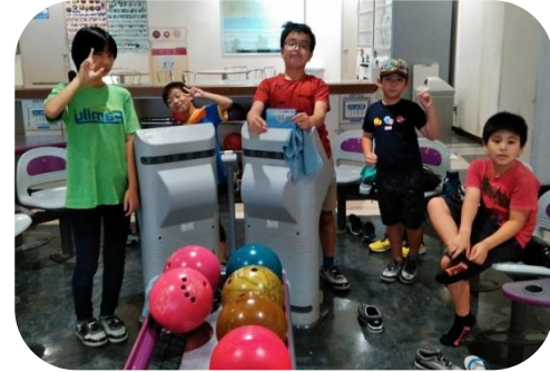
★友だちに教え合いながら、ボウリングを楽しみました!!勝ち負けにもこだわりつつも、自分自身に折り合いをつけて友だちにエールを送ることの出来る子ども達でした。