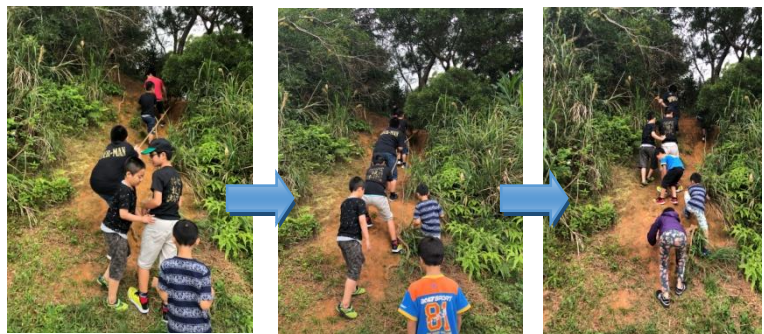
・山登り!!一人増え、二人増え・・・いつの間にか、全員でロープを掴んで登っていました。