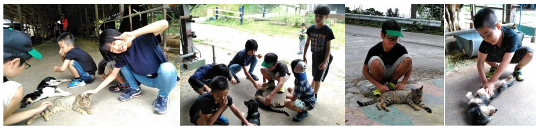
★色々な動物たちとの触れ合いも楽しかったです。いつの間にか動物に癒やされ笑顔になっている子ども達でした★